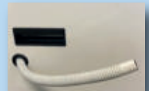
Tragegriff / Wasserableitung 2 m lang