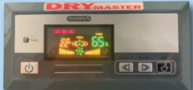
Tableau serienmäßig eingebaut