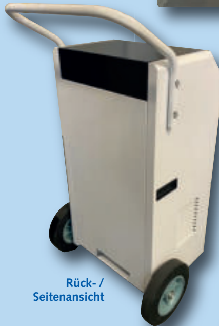
Rück- / Seitenansicht